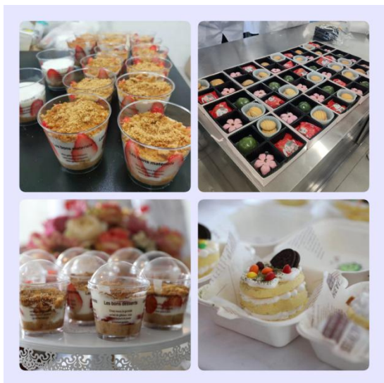
丰富的营养食品制作活动

医学营养专业各类专业活动丰富多彩：每两周一次主题党团活动，依托志愿服务队开展社会服务及专业实践活动，不定期举办专业相关的各项校内活动等，不断提高医学营养专业教学质量和学生职业技能水平，培养学生的思维能力、动手能力和实践创新能力，丰富了学生的日常文化生活，为学生的求学生涯增光添彩。