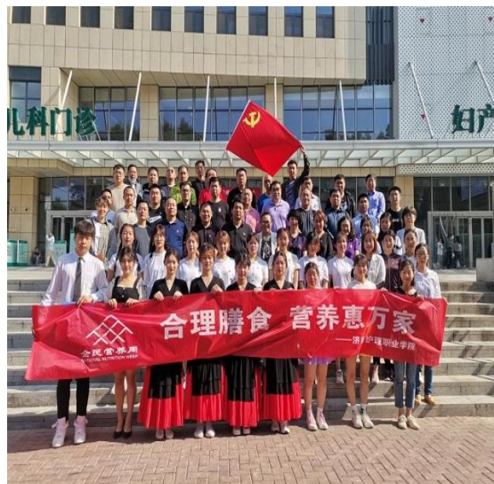
营养周志愿服务活动