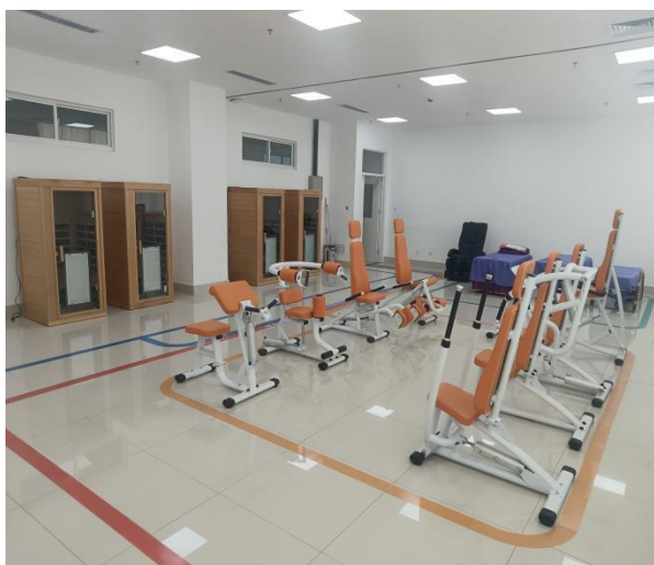
智慧健康管理产教融合实践中心