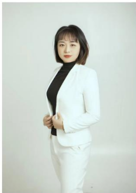
医学营养专业负责人

现有专兼职教师 26 人，其中高级职称 15 人、中级职称 7 人、初级职称 4 人，山东省职教先进个人 1 人、山东省优秀班主任 1 人、国家十佳营养师 1 人，省级优秀基层健康指导员 1 人、济南市岗位技术能手 2 人，双师型比例超过 85%；主编、参编多部国家规划教材，多人获山东省教育科学研究优秀成果奖、省级教学成果奖，获立国家级课题 4 项，省级课题 2 项，市级课题 1 项。该专业教学团队深耕专业、立足教学改革、紧抓科研实践、着眼社会服务，是一支充满活力、锐意进取的教学团队。