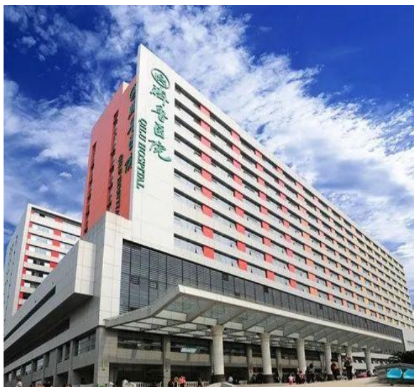
山东大学齐鲁医院